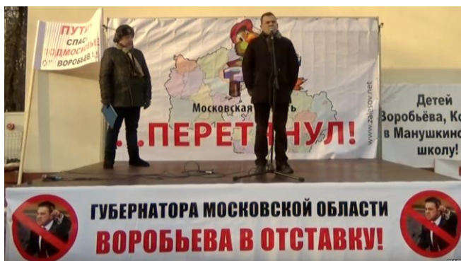
Митинг 20 ноября 2016 года в парке Сокольники в защиту местного самоуправления