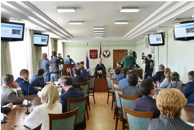
После сегодняшнего заседания правительства Александр Бречалов прокомментировал результаты прошлой сессии городской думы.

рых депутатов городской думы Ижевска, — ответил Бречалов на вопрос журналистов. — Для кого-то игра в политику, свое самоутверждение оказалось выше, чем город Ижевск, горожане, республика. Это не громкие слова, это действительно так. Вы же видите, какие процессы мы запустили, наверно, вы можете оценить качество дорог. Это не просто откуда-то нам свалилось больше денег, это огромная скрупулезная работа. Где здесь депутаты? Здесь не было их. Вы видите, какие задачи мы ставим по объектам социальной инфраструктуры, детские сады и школы. Где здесь депутаты? И что, мы считаем, у кого сколько в бюджете? Нет, конечно. Мы исходим в первую очередь от запроса жителей.