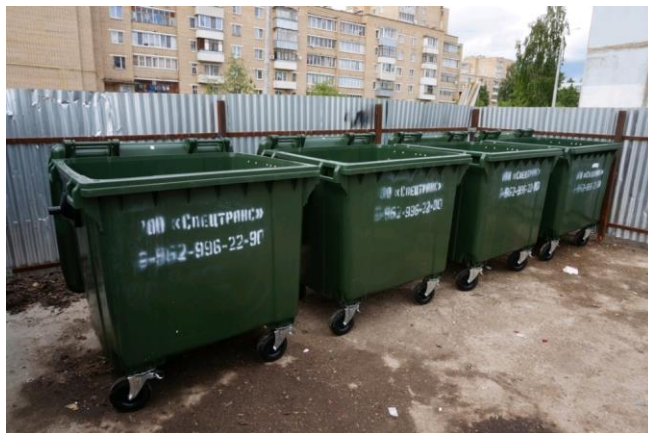
В Воронеже, как и в многих других регионах, на региональных операторов «повесили» обязанность приобретения контейнеров.