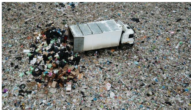
Подмосковный полигон «Ядрово», март 2018 года

После мусорных бунтов , которые прошли в Подмоскowie в 2018 году, здесь были закрыты несколько свалок и полигонов — и Москве стало некуда девать мусор. Уже начато строительство полигона «Шиес» в Архангельской области, но этим дело не ограничится. Как выяснила «Медуза», мусор из Москвы хотят свозить в Калужскую область, в другие районы Архангельской области и еще несколько регионов европейской части России. В Москве для упаковки этого мусора строят три перегрузочных комплекса, один из них — внутри Третьего транспортного кольца, недалеко от метро «Волгоградский проспект». Спецкор «Медузы» Иван Голунов рассказывает о планах мэрии Москвы по вывозу мусора в другие регионы России.